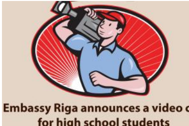
Embassy Riga announces a video competition for high school students