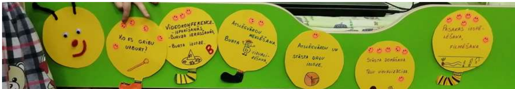
1. posma izvērtējums